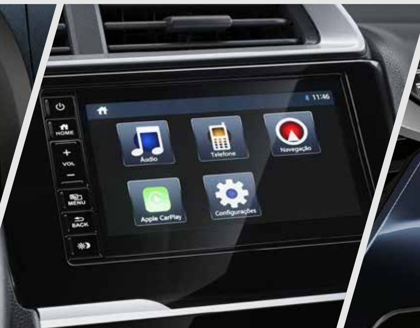
Pantalla táctil 7" con navegador