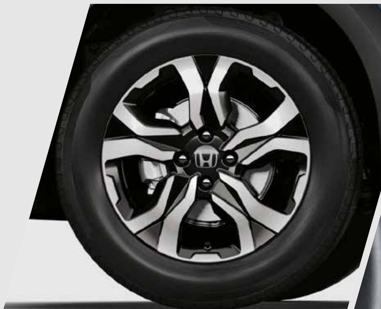
Aros de aleación con acabados de diamante y negro