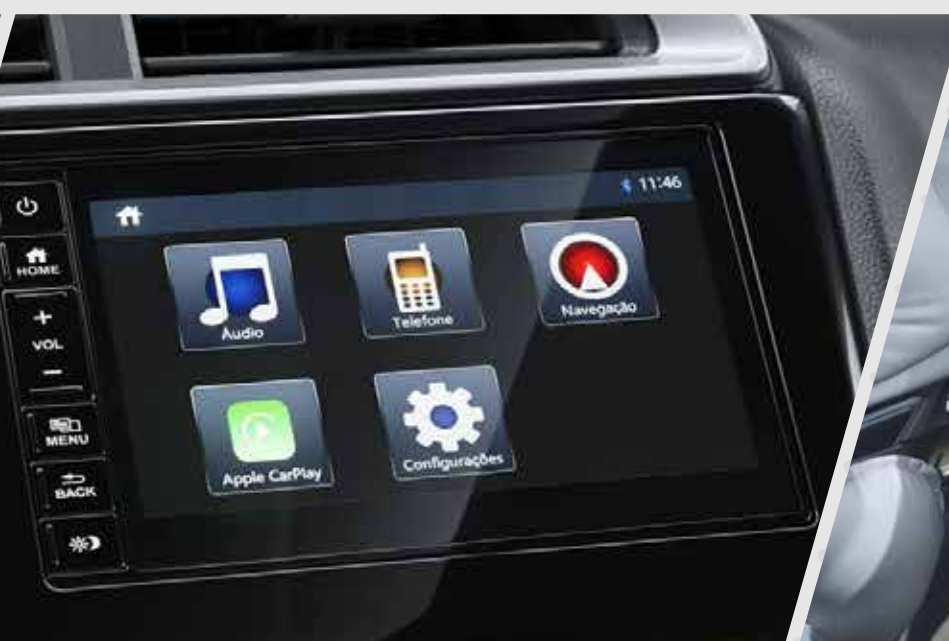
Pantalla táctil 7" con navegador