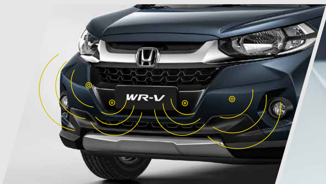
Sensores de maniobra delanteros