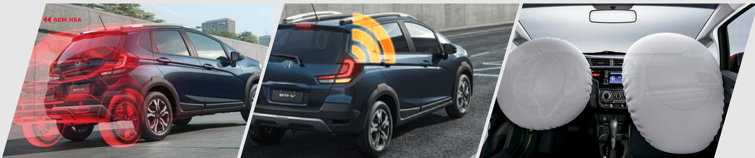
HSA – asistente de arranque en pendiente