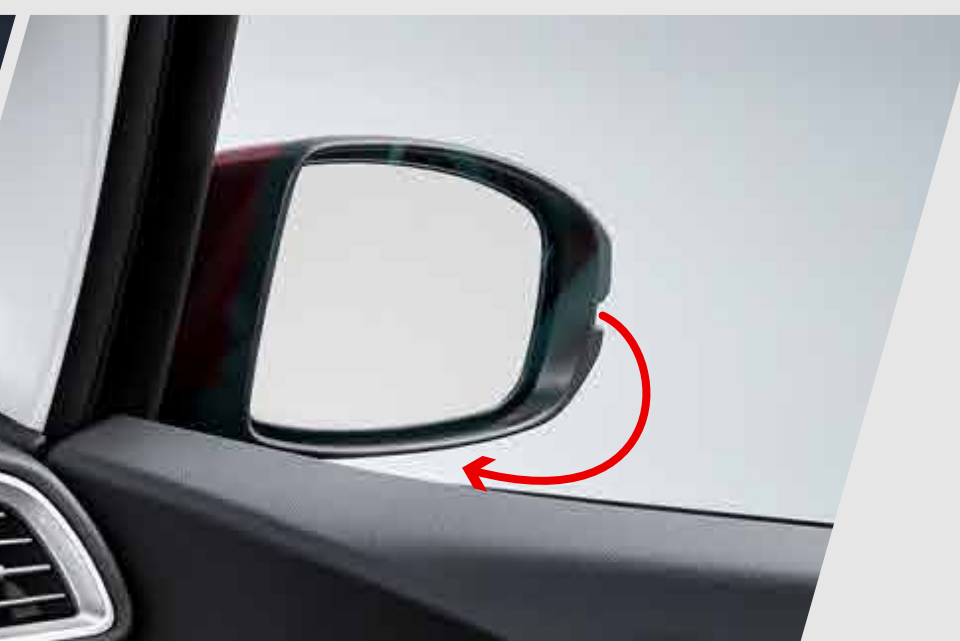
Espejo de inclinación automática