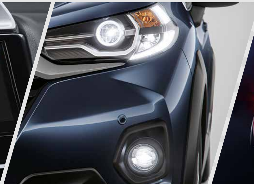
Luces DRL y neblineros LED