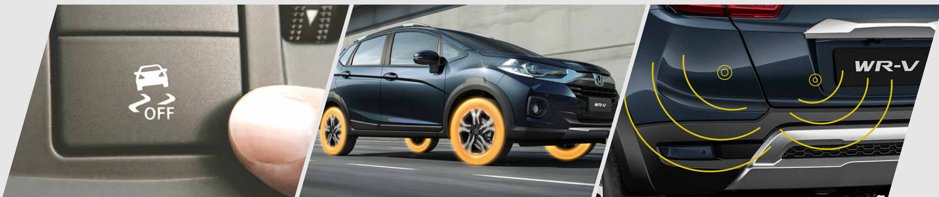
VSA – Asistente de estabilidad