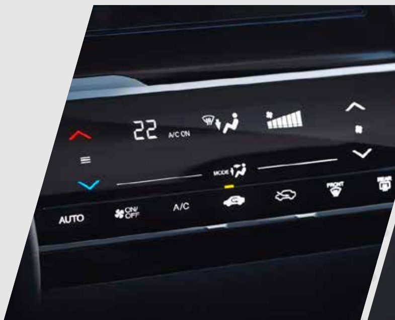
Auto aire acondicionado táctil