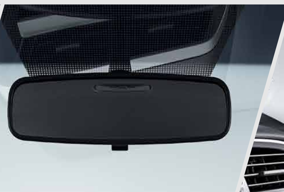
Retrovisor con oscurecimiento automático