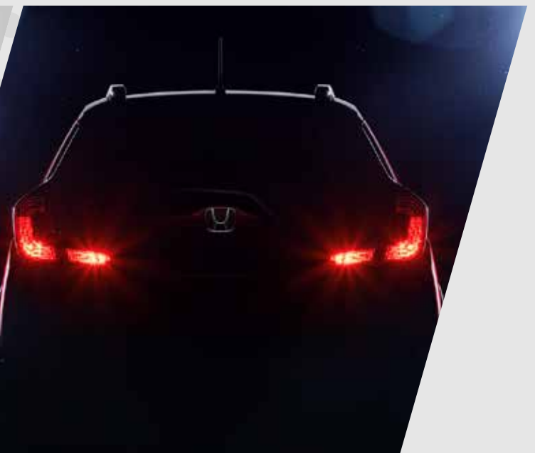
Nuevas luces de freno en LED